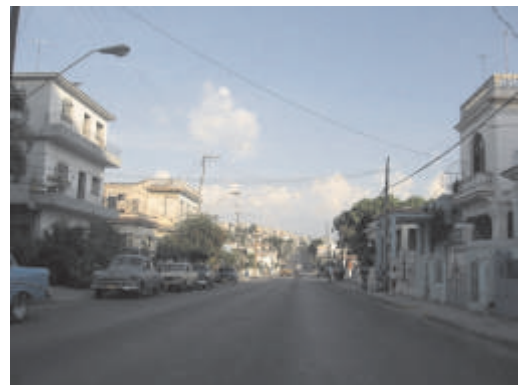
Foto de la calle Lacret. Ciudad de la Habana. Cuba.

Surgen entonces las preguntas relativas a la conservación, cuidado y uso adecuado del entorno construido, también lo relativo a su finalidad, historia y desarrollo prospectivo.