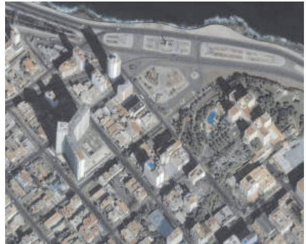
Foto de satélite, zona costera, malecón habanero

Retomemos el concepto y veamos donde comienza nuestra relación con el entorno y como las construcciones que forman nuestras ciudades y son huellas de la civilización humana, forman parte de esa naturaleza a la que agredimos constantemente a la par que disfrutamos e ignoramos.