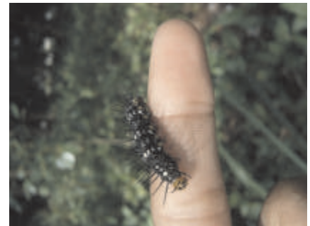
Pedimos la palabra De la serie En buenas manos.