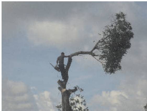
Nos extinguimos. De la serie Desequilibrio.