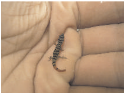
La visita. De la serie En buenas manos.