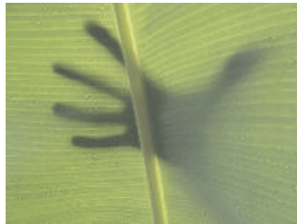
Radiografía de una relación. De la serie En buenas manos.

“Nacemos de ella, nos reproducimos, vivimos, nos alimentamos y aún no nos damos cuenta que muere y los culpables de su enfermedad somos nosotros”.